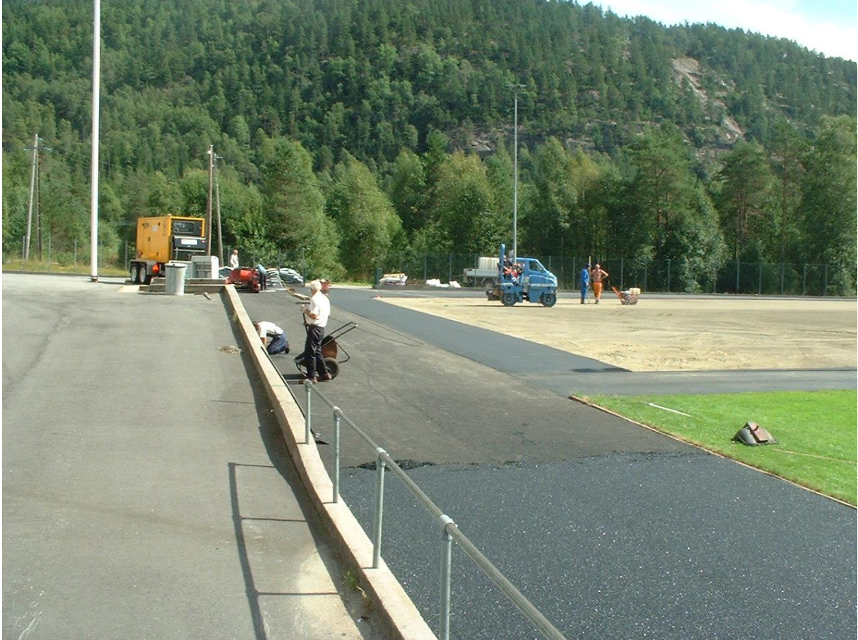
Et tysk firma er her i ferd med å anlegge kunststoff dekke på sprintbanen på Kvinlog. Samtidig legger man asfaltkant rundt den nye kunstgressbanen.

Kvinesdal kommune har satset sterkt på utvikling av gode nærmiljøanlegg rundt de mange grendeskolenene. Dette har medført at så å si hele kommunen er svært godt dekket opp med gode anlegg for egenorganisert aktivitet.