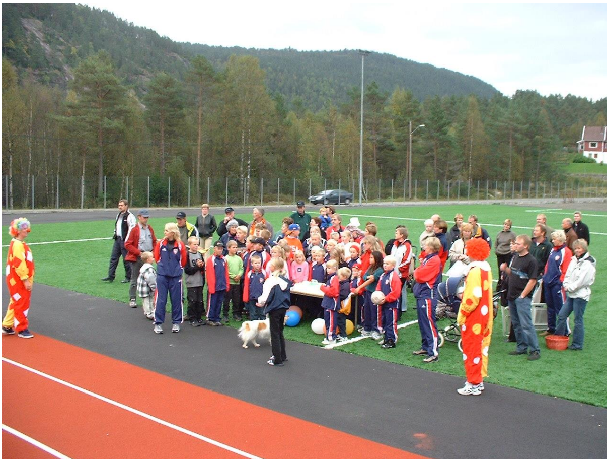
Bilde fra åpningen av Kvinlog kunstgressbane og 110m kunststoff løpebane høsten 2002.

Øye skole fikk ved hjelp av Øye grendeutvalg satt opp ballbinge sommeren 2002. I tillegg er det en brukbar grus/gress bane for fotball.