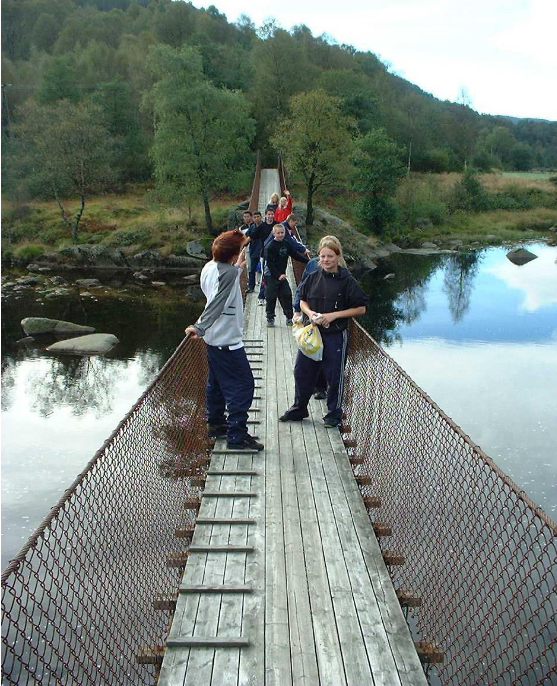
Hengebroa fra Svindland til Egenes er en viktig del av det gamle veinettet opp Vesterdalen. Her er friluftsliv gruppa fra Kvinesdal ungdomsskole på tur.

Det skal utvikles turkart for de mest brukte turområdene i kommunen. Disse områdene skal gies en spesiell oppmerksomhet i forhold til å bedre standarden på disse løypene, slik at de også blir tilgjengelige for besøkende som ikke er lokalkjent.