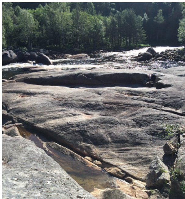
Badeplass i Fossan