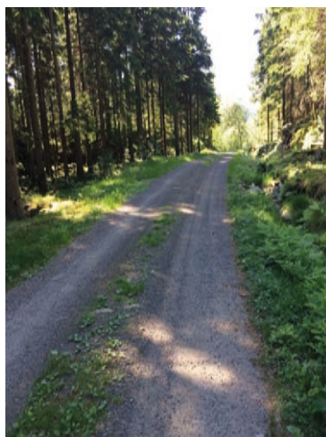
Tilbake mot sentrum